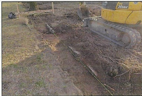
写真4 石列残存状況／北東から