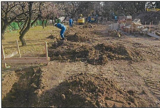
写真2 現場状況／北から