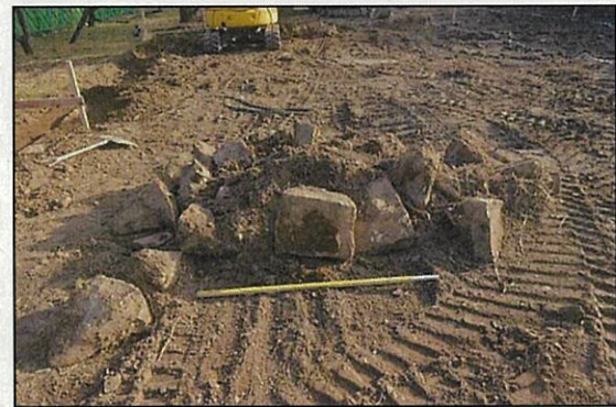
写真3 き損した石材状況／北から