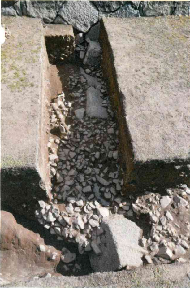
写真1 Xトレンチ 石列検出状況(西から) 正面石垣は大天守台西壁