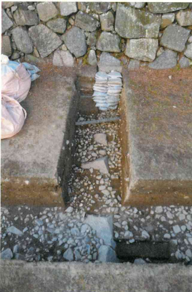
写真2 Wトレンチ 中央付近 石列検出状況(東から) 正面石垣は御深井丸側石垣(U66石垣)