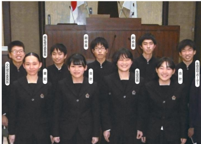
高校生“まち”を動かす!