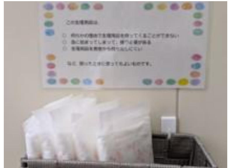
東郷町立の全小中学校女子トイレに配備された「生理用品」