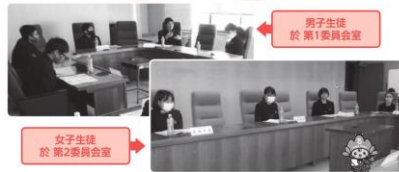
女子生徒 於 第2委員会室

来マ!見マ!話ヤマ!あんざこと、こんざこと... 東郷高校生徒会役員と、東郷町議会広報広聴委員会との意見交換会が催されました。 令和2年12月16日(水) 14:00-16:00 東郷町役場4階 委員会室