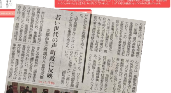
中日新聞なごや東版(R2.12.19)

意見交換会振り返り 意見交換会では、生徒と議員が互いの立場を話し合い、意見を交換しました。生徒からは、学校の施設改善や、地域の活性化に関する意見が数多く出されました。議員からは、生徒の意見に耳を傾け、可能な限り対応していくという姿勢が示されました。