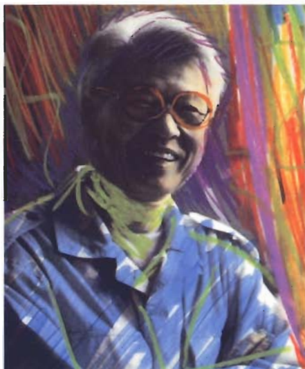
illustration: Margot Campos

This cybernetic sculpture system that focuses on the aspect of homeostatic relation of art to its environment is a new generation of environmental sculptures based on the concept of stability and disturbance.