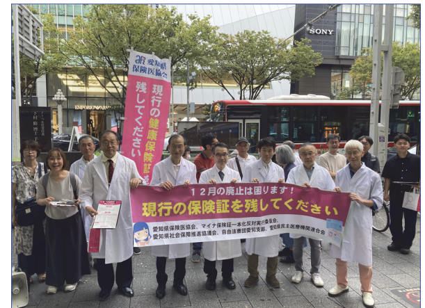
2024/9/29 名古屋市栄でアピールしました